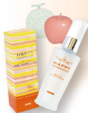
FRUITY & WHITE FLOWER

トップのフルーティーノートはフレッシュで明るい躍動感を感じさせます。豪華なダマスクローズをベースにジャスミン、ライラック等の柔らかなホワイトフラワーをアクセントに加え、ラストノートはウッディーとムスクでホワイトローズの高級感を与えたある香りです。